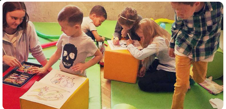
Książki i kolorowanki